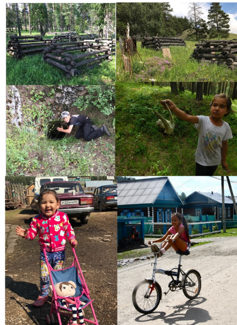
Адамян Л.И., Обухов А.С. Потаенные места башкирских детей // Традиционная культура. 2019. Т. 20. № 2. С. 50-62