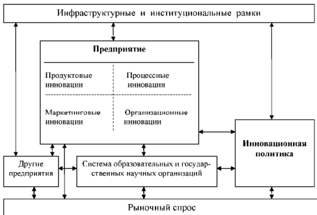
Рис. 2.1. Предметная схема измерения инноваций

Системные подходы к инновациям смещают акцент политики в сторону взаимодействий между организациями и рассматривают интерактивные процессы в создании, распространении и использовании знаний. В них подчеркивается значение условий, регламентов и политики, в рамках которых функционируют рынки, и, следовательно, роль правительств в мониторинге и поисках способов тонкой регуляции всей этой системы.